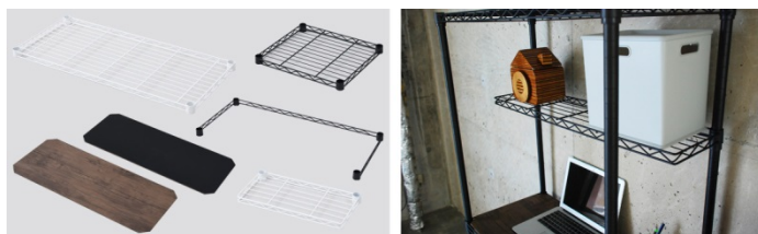
小物置きに便利なハーフ棚、コの字サポート、キャスターはオプションで(木製天板はオプションで追加購入も可能)

「小物を飾る小さい棚が欲しい」、「キッチンで使っているのでキャスターは必要」等、パーツのニーズは様々です。そこで用途に合わせていろいろ選べるよう、ニーズが高い天板は付属パーツにし、コの字バー、追加棚、キャスターはオプションパーツとして拡充しました。