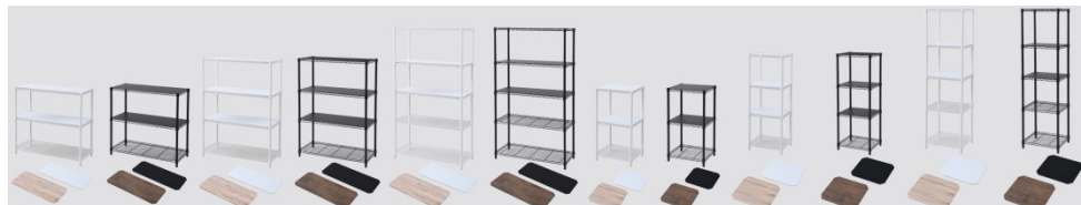
幅は2種類、高さは3種類、カラーは2色展開なので合計12タイプから選べる

「収納ボックスと合わせて使いたい」というユーザーの声を基にサイズを見直しました。幅は、市販の収納ボックスが横向きに2つ、縦向きに3つ入る87cmのワイドタイプ、横向きに1つ、縦向きに2つ入る45cmのスリムタイプの2サイズ展開。高さは、83cm、120cm、157cmの3タイプから選べます。