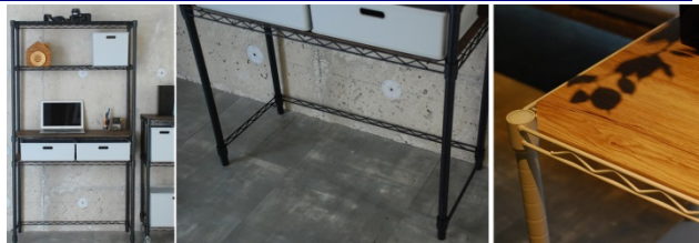
コの字バーでデスクとして使っても安心。リバーシブルの木製天板2枚セット(裏面はブラックとホワイト)

座談会では、「ワイヤー棚は隙間があるので小物が落ちる」、「デスクとしても使いたい」等の意見が多く寄せられました。そこで『おうちすっきりラック』には、リバーシブルの木製天板2枚をセットで付けました。また、デスクとして使用する際に一番下の棚板を抜いても安定するよう、コの字バーをオプションパーツとして用意しました。